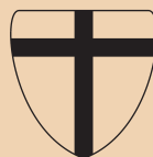
Liivi Ordu vapp